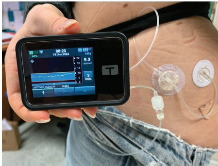
Obr. 3. Inzulínová pumpa se zavedeným infuzním setem

zadáním hodnoty glykémie měřené pomocí glukometru, popř. navrhne optimální řešení aktuální situace. V neposlední řadě většina pump umožňuje nastavení dalších režimů uživatele, např. režim při fyzické aktivitě (zvýšení cílové glykémie, procentuální snížení bazálního inzulínu) nebo při interkurentním onemocnění (zprávnění nastavení v závislosti na zvýšení inzulínové rezistence).